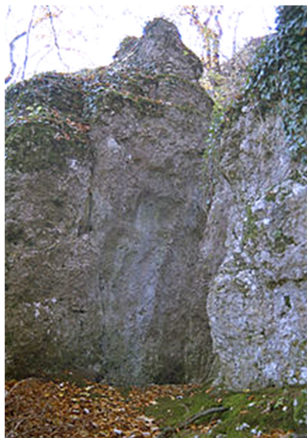
Felskluft des Zugangstors

Auf dem höchsten Punkt des Felsspornes, fast schon in Gipfelage, wurde der älteste Teil der Burg erstellt. Etliche Etagen der Festung wurden in den grossen Felsspalt hinein gebaut, der den Felskopf in zwei Teile spaltet (dieser Spalt bestand schon lange vor dem Basler Erdbeben 1356). Viele Balkenlöcher auf mehreren Etagen lassen die Dimension der Ausbauten im Felsspalt gut erkennen. Weiter ist auch die Stelle des Zugangstors durch die nordöstliche der beiden Felsflanken gut zu erkennen: man nutzte eine natürliche Felskluft, die zu diesem Zweck künstlich erweitert und angepasst wurde.