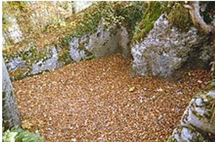
In den Fels gehauener Raum

Fundamente und kleine Mauerreste zeigen, dass ausser dem Turm auf dem obersten Felskopf weitere kleine Gebäude gestanden haben müssen.