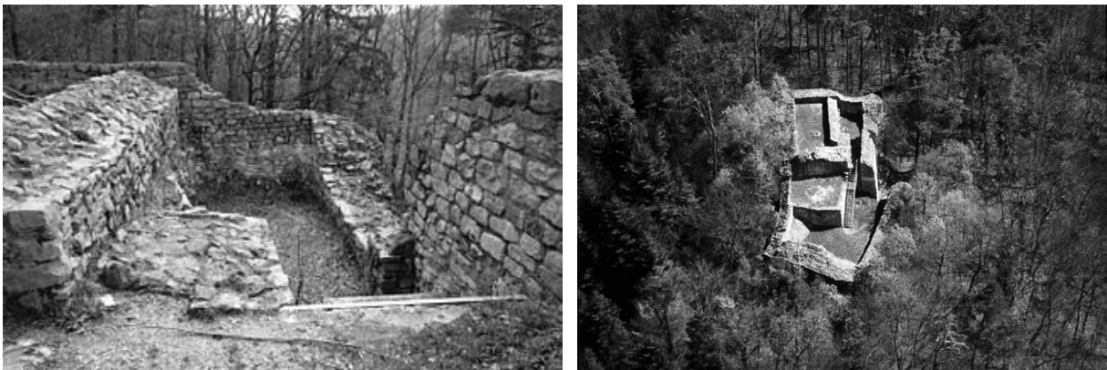
Burg Scheidegg, älterer Teil

Auf Grund der Lage auf der Felsrippe war die Scheidegg durch Felswände und steiles Gelände natürlich geschützt. Grabungsergebnisse und Bodenfunde zeigen, dass die Anlage in zwei Bauphasen zwischen 1220 und 1250 errichtet wurde.