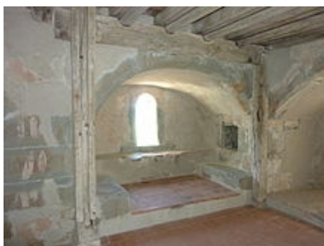
Fensterische im Turm

Die Geschichte der Burg Hohenklingen ist eng mit der Geschichte des Städtchens Stein am Rhein und dem Kloster St. Georgen verknüpft. Um 1200 errichtete der Kastvogt (= Hauptvogt) des Klosters an der Stelle der heutigen Anlage einen Wohnturm. Es ist anzunehmen, dass bereits die früheren Kastvögte des Klosters, die Zähringer, dort einen hölzernen Wohnturm mit einem Befestigungsgraben im Norden errichtet hatten, der nach ihrem Aussterben von den Freiherren von Klingen übernommen und ausgebaut wurde.