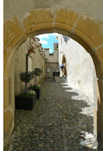
Aussicht auf Stein am Rhein

Über dem Palas wurde 1423 das 3. Obergeschoss errichtet. Damit erhielt die Burg ihr heutiges Bauvolumen. Der Rittersaal im Palas ist geschmückt mit neuzeitlichen Darstellungen der Wappen der Herren von Hallwyl, Toggenburg, Brandis, Fürstenberg und Österreich.