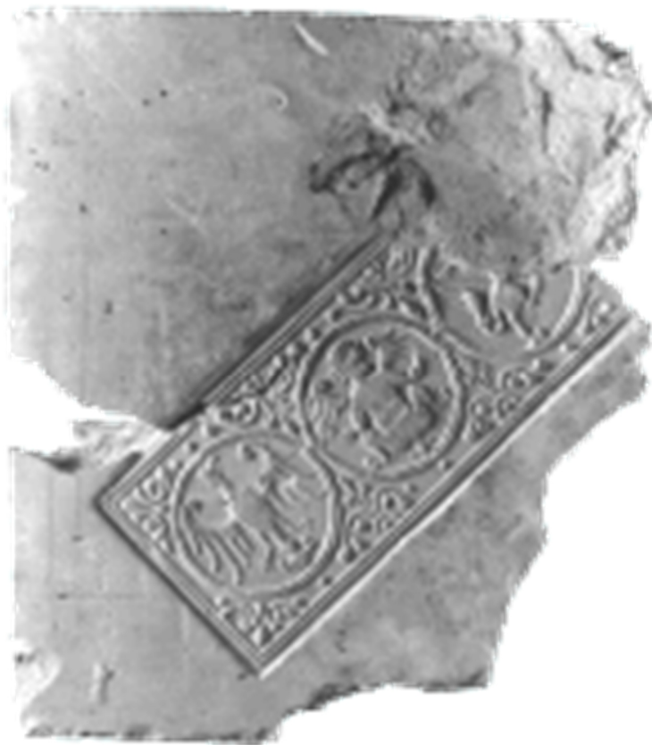
Bodenplatte von Grünenberg mit einer Darstellung dreier Figuren in Medaillons.